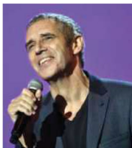
Julien Clerc est attendu au Tube le 25 mars 2022.

Jeudi 18 février, la salle du Tube, à Seignosse, a dévoilé la date d'un concert de Julien Clerc, dans le cadre de sa tournée intitulée « Nos Jours heureux ». Le chanteur français, qui présentera notamment son nouvel album « Terrien », se produira sur la scène seignossaise le vendredi 25 mars 2022. La billetterie est d'ores et déjà ouverte sur le site du Tube.